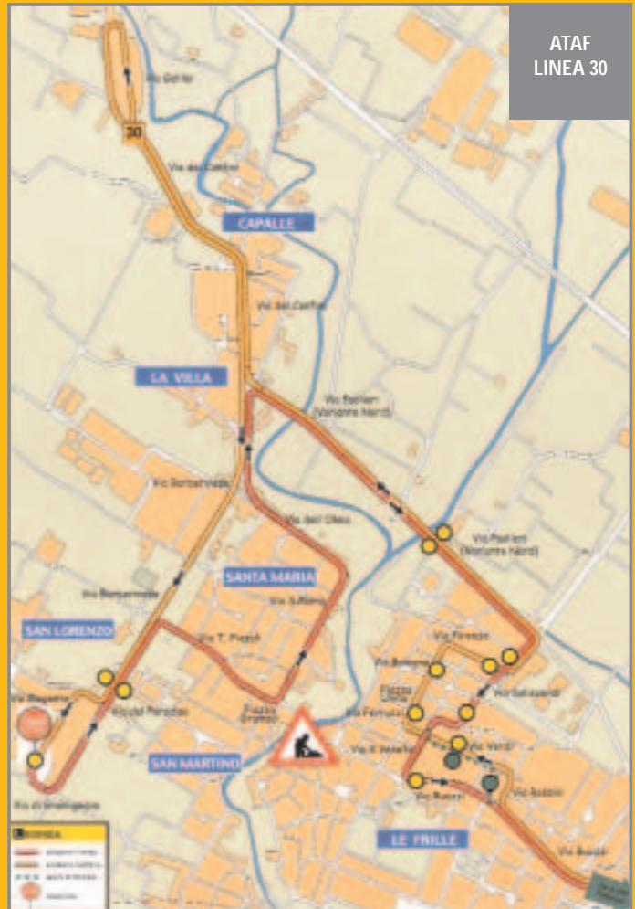
ATAF LINEA 30

Sul percorso sono state istituite 12 nuove fermate e il prolungamento della linea 30 collegherà anche la zona di via Barberinese dove farà capolinea. Sarà eliminata la navetta prevista per il sabato e per i giorni di chiusura del centro storico perché quando parte di via Buozzi o via Vittorio Veneto sono chiuse l'autobus in direzione di Firenze proveniente da via Saliscendi transiterà da via Verdi e via Rossini per rimettersi su via Buozzi.